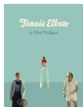
TENNIS ELBOW de Vital Philippot, Fiction 2012 (prix France TV Clermont 2013)