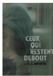
CEUX QUI RESTENT DEBOUT de Jan Sitta, Fiction 2013 (Prix CCAS Premier Plans Angers 2014)