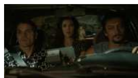
SEXY DREAM de Christophe Le Masne, Fiction 2013 (Mention spéciale du Jury Clermont-Ferrand 2014)