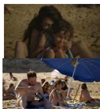
OCEAN d'Emmanuel Laborie, Fiction 2013 (Semaine de la Critique Cannes 2013)