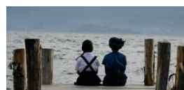
QUANDO SEA GRANDE de Jayro Bustamante, Fiction, 2011