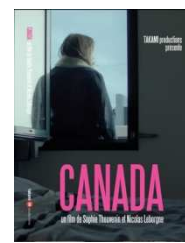
CANADA de Sophie Thouvenin et Nicolas Leborgne, Fiction 2013 (Prix Interprétation féminine et Musique à Itinérance/Alès 2014)