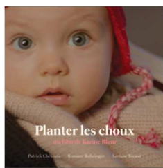
PLANTER LES CHOUX de Karine Blanc, Fiction 2014