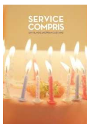
SERVICE COMPRIS de Stephan Castang, Fiction 2014